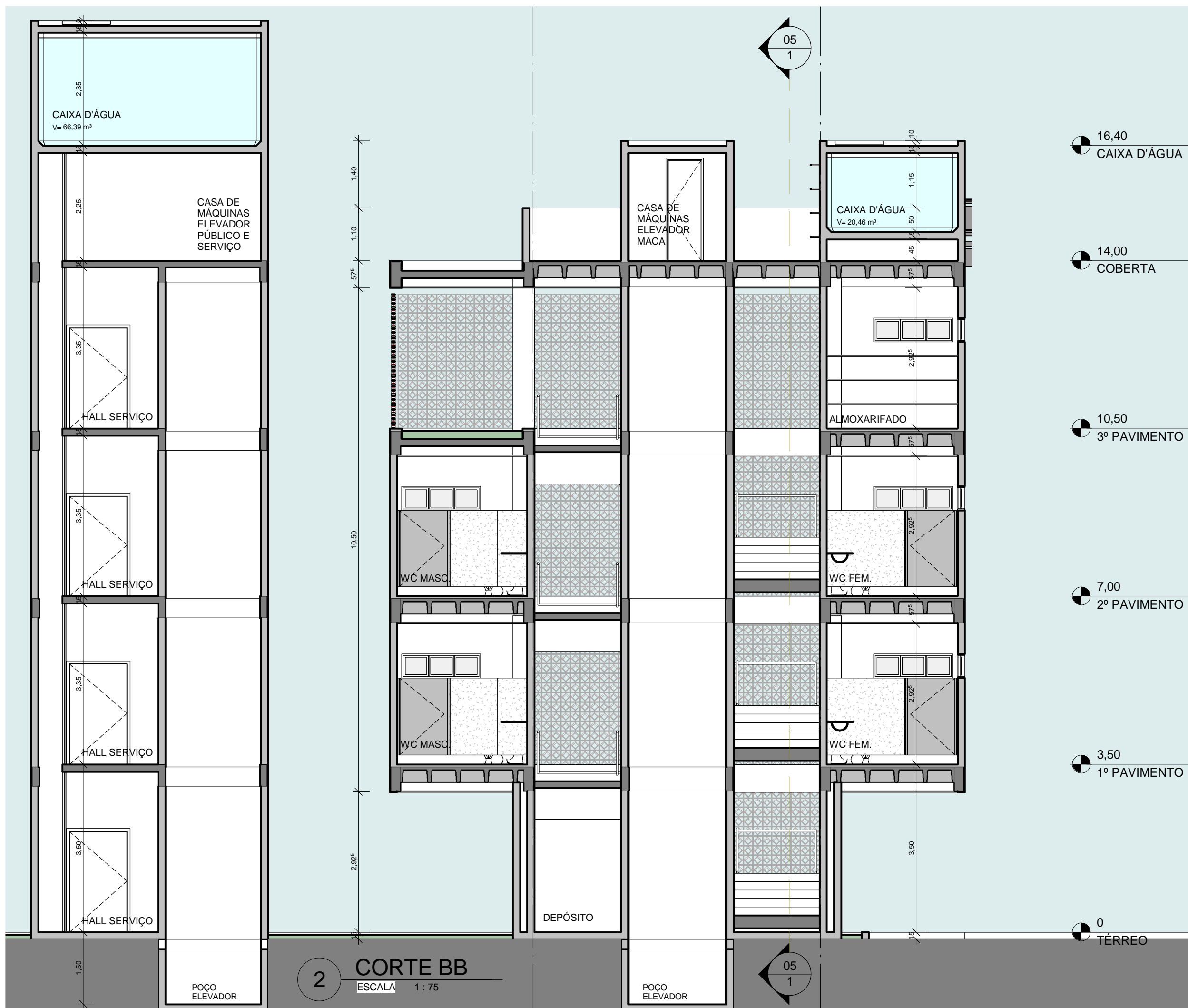
2 CORTE BB ESCALA 1:75