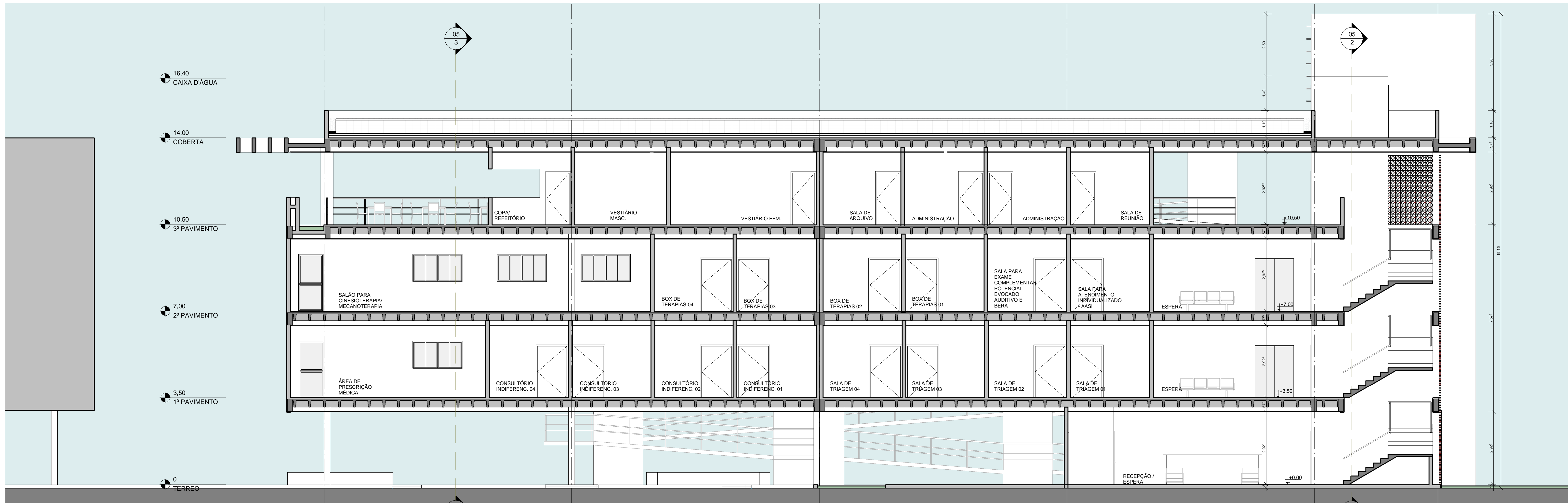
1 CORTE AA ESCALA 1:75